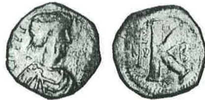
Justinus I., 20 Nummi MIBE N56: Kyz., Off. B