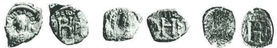
Justinian I., 8 Nummi MIBE 174m: Thess., ΘΕΩΙ / ●