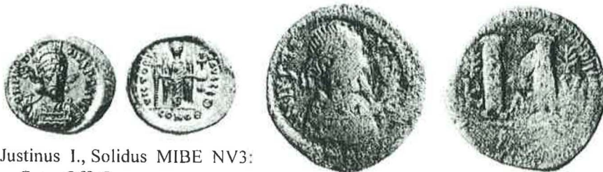
Justinus I., Solidus MIBE NV3: Con., Off. Θ