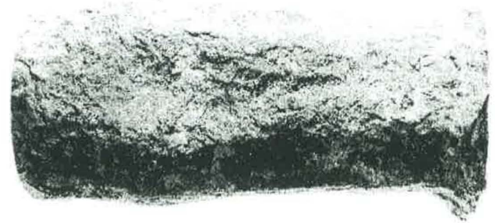
„Falschmünzer“-stempel zu Justinus I., 40 Nummi MIBE 35: Niko.