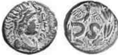
Abb. 1. Münze aus Hatra – Gorny & Mosch 2002, Nr. 1841