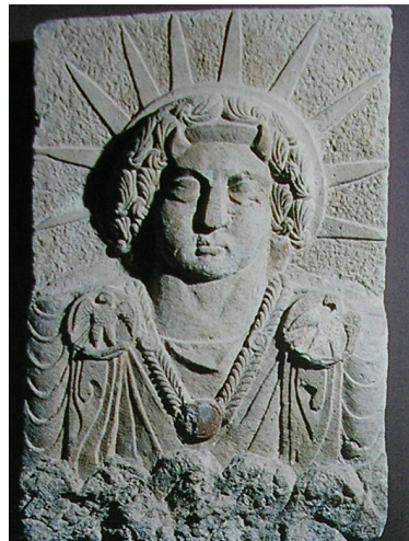
Abb. 3. Reliefdarstellung eines Gottes mit Strahlenkrone, wahrscheinlich Maran / Shamsh; Sommer 2003, S. 76.