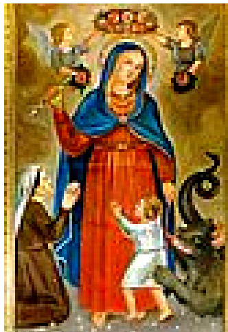
Abb. 4. Bildliche Darstellung im Heiligtum selbst – digilander.libero.it/rotondonet/Festa%20bambini.htm (1. 1. 2008).

Das zweite Stück, welches in Rotondo hergestellt wurde, stammt aus dem Jahr 2002. Es ist dem 20. Jubiläum des so genannten Corsa dei biroccetti – einer Art Seifenkistenrennen, welches von den Kindern der Ortschaft zu Ehren der Madonna del Cerro stattfindet – gewidmet.