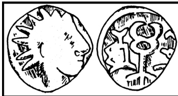
Abb. 4. Münze, Hadramaut – Sedov 1998, II, 1

Eine Aversvariante auf Münzen Hadramauts weist dieselbe Darstellungsweise auf. Die Zuweisung des Shams – dies ist die altsüdarabische Entsprechung des Shamash – ist möglicherweise durch eine Lesungsvariante des Musnad Monogramms im Revers nachzuweisen.