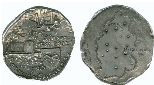
Abb. 5. Medaille zum 20. Jubiläum des Corsa dei biroccetti 3

Das zweite Stück, welches in Rotondo hergestellt wurde, stammt aus dem Jahr 2002. Es ist dem 20. Jubiläum des so genannten Corsa dei biroccetti – einer Art Seifenkistenrennen, welches von den Kindern der Ortschaft zu Ehren der Madonna del Cerro stattfindet – gewidmet.