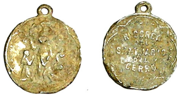
Abb. 1. Weihemedaille aus Rotondo

Vor einem Jahr beschrieb ich im Mitteilungsblatt des Instituts 1 ausgewählte Weihemedailles aus dem mittelitalienischen Raum. Bei einem dieser Stücke handelte es sich um eine Weihemedaille, die dem Santuario del Cerro gewidmet war, deren Legende ich damals auf Grund der starken Korrosion nicht vollständig auflösen konnte. Nach einem Lokalaugenschein des Heiligtums im Sommer letzten Jahres konnten die bildliche Darstellung und die Legende des Stücks geklärt werden.