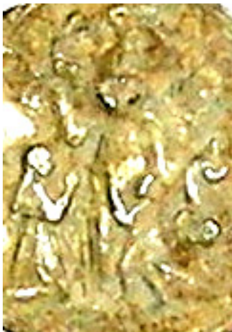
Abb. 3. Vergrößerter Ausschnitt der Darstellung der Madonna del Cerro auf der Medaille