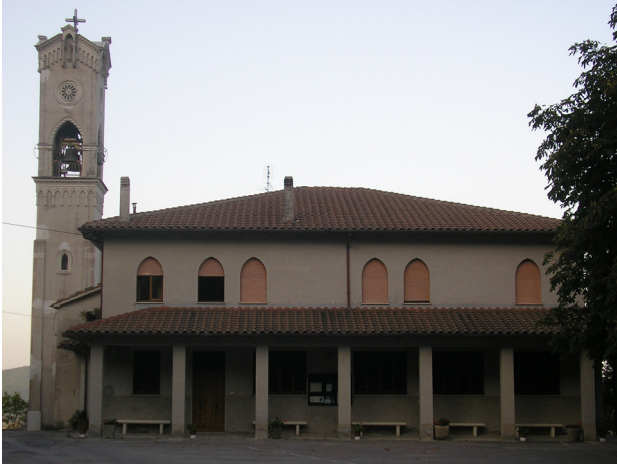
Abb. 2. Seitenansicht des Santuario del Cerro