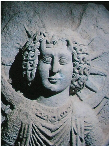
Abb. 2. Reliefdarstellung einer Gottheit mit Strahlenkrone, durch die Inschrift Bar-maren zuzuweisen; Sommer 2003, S. 75.

Vergleichbare Darstellungen des Sonnengottes mit Strahlenkrone begegnen uns auch auf einigen Reliefs, die in der Stadt selbst gefunden wurden (Abb. 2 und Abb. 3).