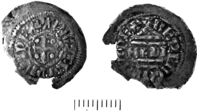
Vergrößerung (Maßstab 2 : 1)