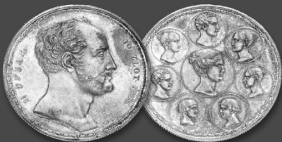
Auktion 203 Kaiserreich Russland. Nikolaus I., 1825 – 1855. 1½ Rubel (10 Zlotych) 1835, St. Petersburg. Familienrublel. Taxe: 150.000 €. Zuschlag: 650.000 €.