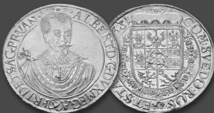
Auktion 239 Wallenstein. Albrecht, 1623 – 1634, Herzog von Friedland. 10 Dukaten 1631, Jitschin. Taxe: 150.000 €. Zuschlag: 180.000 €.