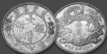
Auktion 180 China. Hsuan Tung, 1908 – 1911. Dollar o.J. (1911), Tientsin. Probe mit GIORGI. Taxe: 10.000 €. Zuschlag: 460.000 €.

eLive Auction, Online-Shop und online bieten – direkt bei uns im Internet: www.kuenker.de